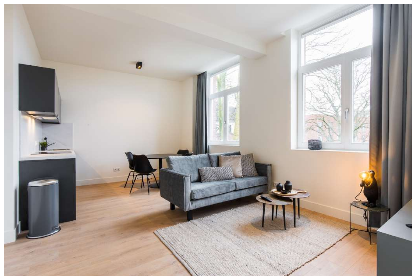
Foto is ter illustratie en betreft een ander appartement uit onze portfolio

Bij interesse verzoeken wij u contact op te nemen met Living in Holland, te bereiken per telefoon op 06 11053763 of per email op info@livinginholland.eu voor het inplannen van een afspraak.